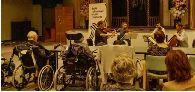
Satelliet-concert in de Bieslandhof

wondertje dat de boottocht door kon gaan, ook mede dankzij de flexibiliteit van Stichting Stunt, Rondvaart Delft en een restaurant.