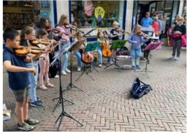
Impressies van de Kroeg- en straatmuziek

Extraatje: Een vioolspelende fysiotherapeute (zelf voor de derde keer deelnemer bij het KAD) gaf kleine workshops en werkte met enkele deelnemers aan massage- en adem oefeningen.