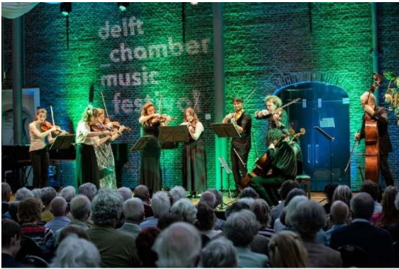
Twee jong-talent deelnemers op het DCMF-podium