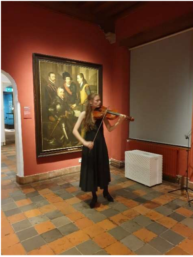
Altvioliste tijdens pop-up-optreden

Het KAD heeft dit jaar ook inhoudelijk aan het DCMF mee kunnen werken: vijf aan het KAD deelnemende conservatoriumstudenten mochten binnen het DCMF optreden en de SKAN was blij de jonge musici tussen de 18 en 23 jaar deze unieke kans te kunnen bieden. Twee studenten verzorgden op 29 juli solistische pop-up-optredens in het 'afterprogramma' van het concert Hollandse meesters in muziek en verf ; twee violisten speelden op 1 augustus in het programma 'Noorderlicht' mee met het DCMF-kamerorkest en twee cellisten traden op 4 augustus op tijdens de Jong Talent Route . Ook het optreden in de Bieslandhof werd gemeenschappelijk door