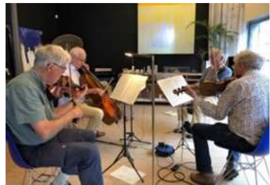
De oudste deelnemers – blij met hun vaste les- en repetitielocatie

De ensembles werkten aan uiteenlopend repertoire . Naast het bekende klassieke en romantische standaardrepertoire en enkele minder bekende composities stonden er dit jaar bij maar liefst 7 ensembles ook hedendaagse stukken of eigen gecomponeerde/gearrangeerde werken op de lessenaar. Een 16-jarige amateurpianist voelde zich tijdens het KAD zelfs geïnspireerd om voor zijn ensemble (twee jongens van 15 en 18 jaar uit Canada) een kort stuk te schrijven. Een deelnemende saxofonist schreef nog enkele weken voor begin van het KAD een passende bewerking van filmmuziek (Westworld van componist Ramin Djawadi), helemaal passend gemaakt voor de 15 deelnemende blazers en docent Raaf Hekkema. Dit was een unieke aanvulling van het cursusrepertoire.