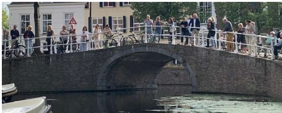
Luisteraars bij de Muzikale Boottocht