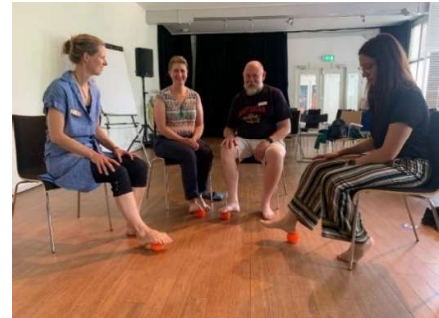
Deelnemer geeft Fysio-workshop

Vooraf de cursisten die niet alle concerten van het DCMF bezochten gebruikten de kans om in hun vrije blokken te ontspannen en meer over de werking van hun spieren te leren.