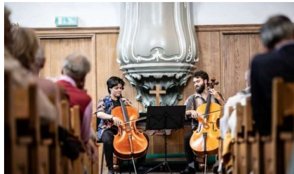
Twee jonge cellisten tijdens het KAD in Café de Klok en een week later in de Lutherse Kerk tijdens het DCMF